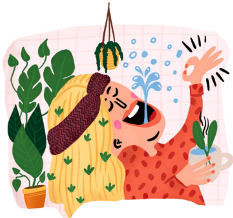
Mit Salbeitee gurgeln desinfiziert, wirkt entzündungshemmend und lindert Halsweh.

Achtung: Eukalyptusöl kann die Haut reizen, es sollte nie unverdünnt verwendet werden. Für Babys und Kleinkinder ist Eukalyptus nicht geeignet, da die ätherischen Öle Atemnot auslösen können.